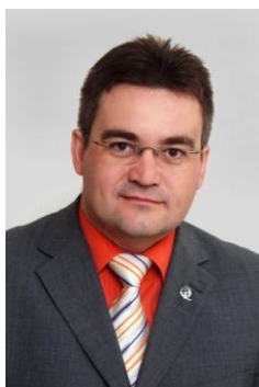
Petr Švec prezident